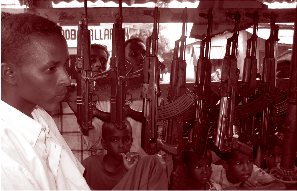
تاجر سلاح بدأ التجارة في سن العاشرة في متجره في سوق بركا، مقديشو، الصومال، يونيو/ حزيران ٢٠٠٦.