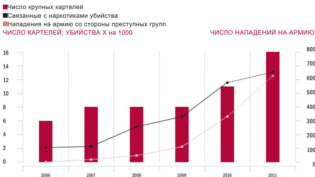
Рисунок 2.5: Дробление картелей и насилие, связанное с наркотиками в 2006-11 гг.

Примечание: Показатели убийств и нападений за 2011 год являются результатом оценки, основанной на данных за период с января по июнь. Источники: Данные Reforga, приведенные в Герреро-Гутьеррес (2011, стр. 45.); Аранда (2011); Риос и Ширк (2011)