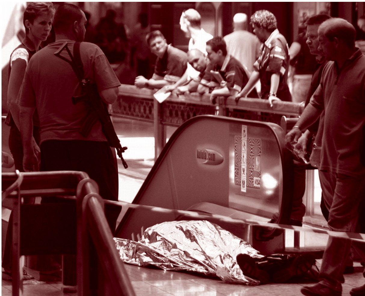
Um assaltante jaz morto após levar um tiro que teria sido disparado por um guarda particular de segurança em assalto durante a entrega de numerário num centro comercial de Joanesburgo, setembro de 2006.