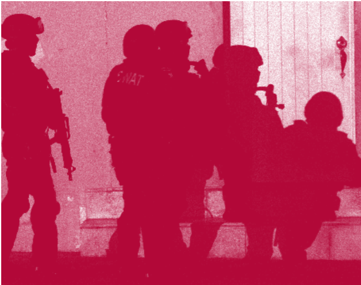
Спецназ оказывает поддержку полицейским при аресте подозреваемого в нелегальной торговле оружием около Ябукюа, Пуэрто-Рико, в сентябре 2007 года.

Очевидно, что предотвратить попадание легкого и стрелкового оружия в нелегальный оборот лучше всего до момента его экспорта, во время выдачи экспортной лицензии. На этом этапе можно всесторонне оценить риски утечки и тщательно проверить конечных пользователей. Однако одного лишь лицензирования экспорта недостаточно. Определить (и предотвратить) действительный случай утечки и, в конечном счете, усилить и улучшить предварительную оценку рисков поможет послепоставочный контроль, включая подтверждение доставки и мониторинг конечного использования оружия.