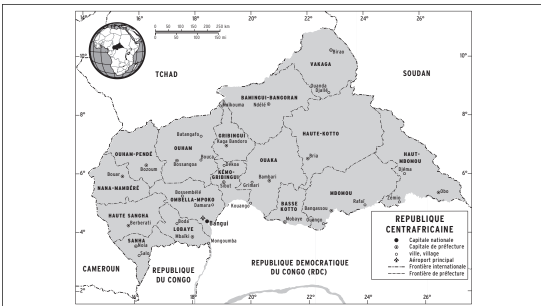
Carte 11.1 La République centrafricaine et ses voisins

Cette étude souligne les liens qui existent entre les différents conflits et la manière dont, si l'on y prête pas attention, les progrès réalisés dans un pays peuvent entraver ceux réalisés dans un autre.