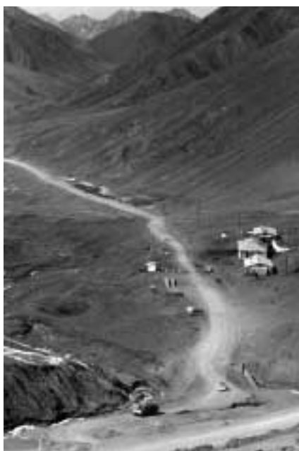
Este remoto puesto de control de la frontera Kirgui en Kyzyl-Art, representa una débil amenaza para traficantes que viajan por las ventosas carreteras dentro y fuera de la vecina Tajikistán.

Contrariamente a lo que algunos analistas europeos argumentan, este estudio no encuentra evidencias que sugieran el embarque de mercaderías en gran escala hacia el norte de armas pequeñas y ligeras, desde Afganistán a través de Asia Central. Analistas declaran la existencia de tales flujos presuponiendo que el flujo de armas acompaña el flujo de drogas. La mayoría de los analistas locales y de los agentes policiales en Kirguizistán todavía afirma que existe tráfico de armas en dirección al norte.