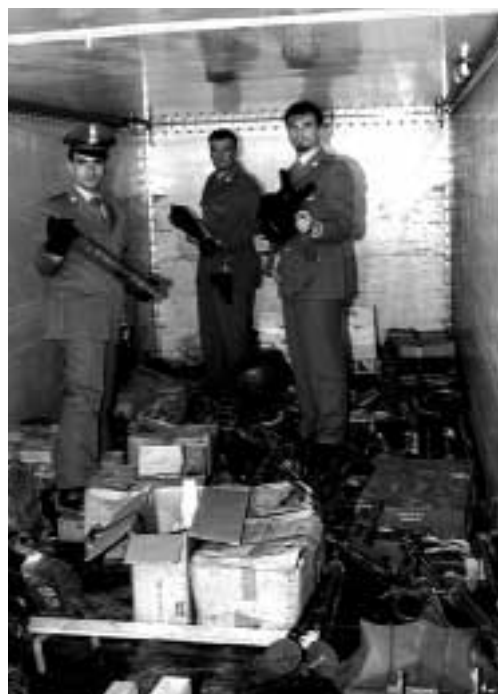
La policía aduanera italiana encuentra armamento en un camión cuya declaración dice que contiene ayuda humanitaria para los refugiados de Kosovo, en abril de 1999.

Los controles sobre la intermediación legal e ilegal están estrechamente vinculados: a no ser que los estados regulen los primeros, serán incapaces de impedir estos últimos.