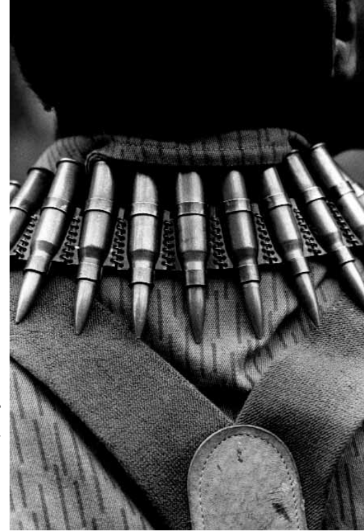
Ожерелье из патронов украшает руандийского повстанца

Прямое влияние распространения стрелкового оружия и его бесконтрольного использования на гуманитарное развитие может быть измерено и зафиксировано эмпирическим путем. Оно является одной из наиболее распространенных причин смертельных и несмертельных ранений во многих развивающихся странах. Это прямое влияние включает не только физическую боль и страдания жертв, но и увеличивает стоимость лечения и восстановления, альтернативные издержки на длительную нетрудоспособность и утраченную производительность домашних хозяйств. В Южной Африке и Уганде - странах, где огнестрельные ранения являются основной причиной смерти, - значительная часть жертв залезают в долги, чтобы оплатить медицинские расходы по лечению своих ранений. Более того, прямое бремя в виде угрозы жизни в сочетании с непрямым бременем рэкета и уклонения от уплаты налогов составляют издержки жизненного уровня сообществ.