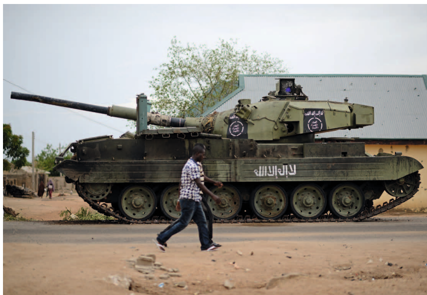
Un char portant l'emblème de Boko Haram à Yola, dans l'État d'Adamawa, après que la ville a été reprise par l'armée nigériane, mai 2015.

tes. De plus, elles n'attirent pas l'attention des médias dans la mesure où elles ne font que peu de morts, et les pays contributeurs de troupes et de policiers n'ont pas vraiment intérêt à diffuser des informations relatives à ces incidents. Pendant les années 1990, les patrouilles des missions de la CEDEAO au Liberia et en Sierra Leone ont subi de nombreuses attaques (comme leurs convois et leurs sites fixes) à l'occasion desquelles les soldats de la paix ont perdu des armes et des munitions 27 . Hors du continent africain, plus précisément en Afghanistan, une patrouille de l'OTAN menée par des soldats d'un PCT de la Force d'assistance internationale à la sécurité (ISAF) a subi une attaque en août 2008. Dix soldats de l'ISAF ont péri à cette occasion (Smith, 2018). Le Small Arms Survey estime que les talibans se sont emparés d'au moins 10 armes, puisque le PCT n'a retrouvé ses soldats que le lendemain (Smith, 2018).