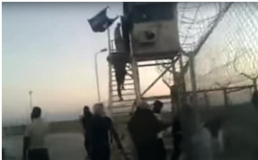
Dans ce plan fixe extrait d'une vidéo diffusée sur YouTube, des membres des communautés locales escaladent un poste de garde situé dans le camp nord de la FMO après avoir ouvert une brèche dans la clôture qui sécurisait le périmètre, septembre 2012.

Néanmoins, il semble établi que des centaines d'armes légères, des milliers d'armes de petit calibre et des millions de munitions ont été perdues dans ces diverses circonstances. Cette estimation reste valable que l'on comptabilise ou non les pertes en matériel subies par l'opération conjointe de l'UA et de l'ONU en Somalie. Selon le Small Arms Survey, au moins sept organisations non onusiennes ont perdu des armes