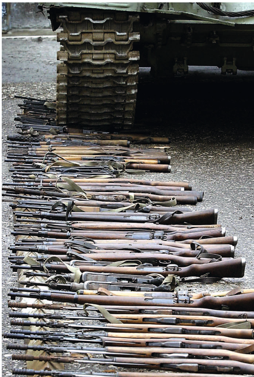
Des fusils détenus illégalement sont détruits dans le cadre d'une collecte d'armes organisée par la SFOR (OTAN), Banja Luka, avril 2004.